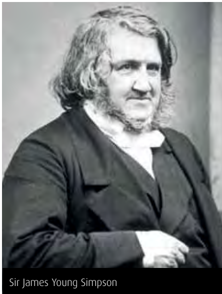
Sir James Young Simpson

cuideachadh tighinn gu Sunflower Garden agus coinneachadh ri daoine eile. Dh'èist daoine rium. Thig gu Sunflower gus am bi fios agad nach eil thu nad aonar."